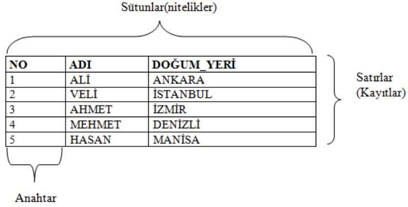
Şekil 1.1: Tabloların özellikleri

Şekil 1.2' de tablolar arası ilişkiler gösterilmektedir.