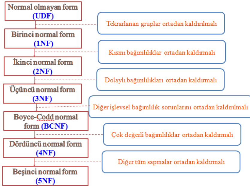
Şekil 2.13: Normalizasyon basamakları

Veri tabanı tasarımına başlarken hazırlamış olduğumuz tablo normal olmayan formda olduğundan bazı sıkıntılar olacaktır. Bu sıkıntıları ortadan kaldırmak ve veri tabanımıza erişimi kolaylaştırmak için normalizasyon kurallarının uygulandığından bahsettik. Bu kuralları bir başlıkta toplarsak elimize aşağıdaki gibi bir normalizasyon algoritması ortaya çıkar.